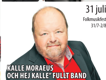
KALLE MORAÆUS OCH HEJ KALLE' FULLT BAND